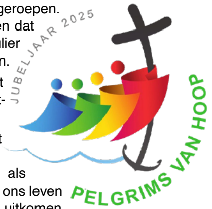
Foto voorpagina afkomstig van jubileumprentje Heilig Jaar

Wie niet naar Rome kan of wil gaan, kan ook in de eigen regio een pelgrimstocht van hoop maken. Limburg telt tal van lokale bedevaartplekken waar dit kan, maar speciaal voor het Heilig Jaar is Roermond als centrale plek aangewezen. Er is een programma voor een jubileumbedevaart van één dag ontwikkeld, waarin pelgrims de Sint-Christoffelkathedraal, de Munsterkerk, de Caroluskapel en de (protestantse) Minderbroederskerk kunnen bezoeken. Dit kan het hele jaar door. Meer hierover leest u (vanaf eind december) op de website van het bisdom.